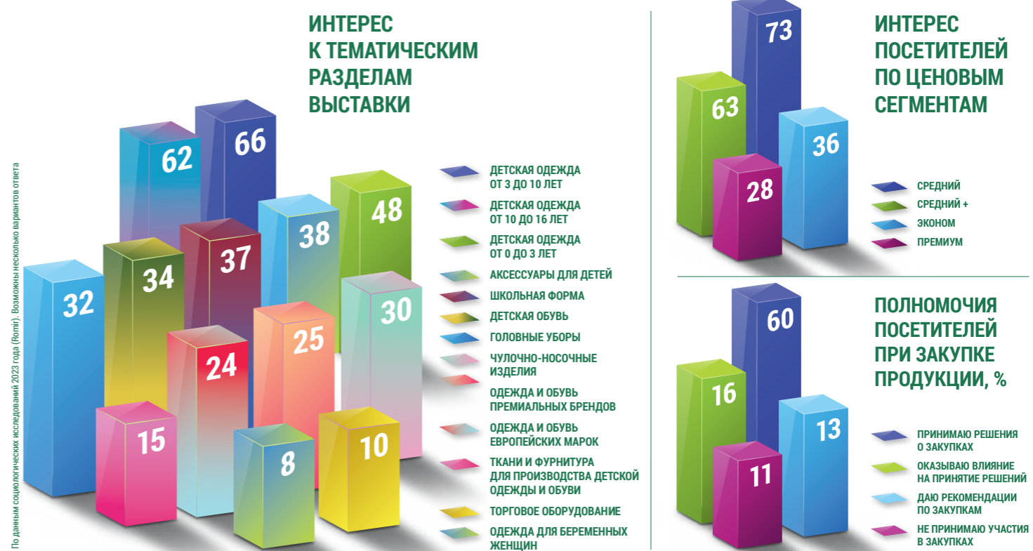
По данным социологических исследований 2023 года (Полит). Возможны несколько вариантов ответа